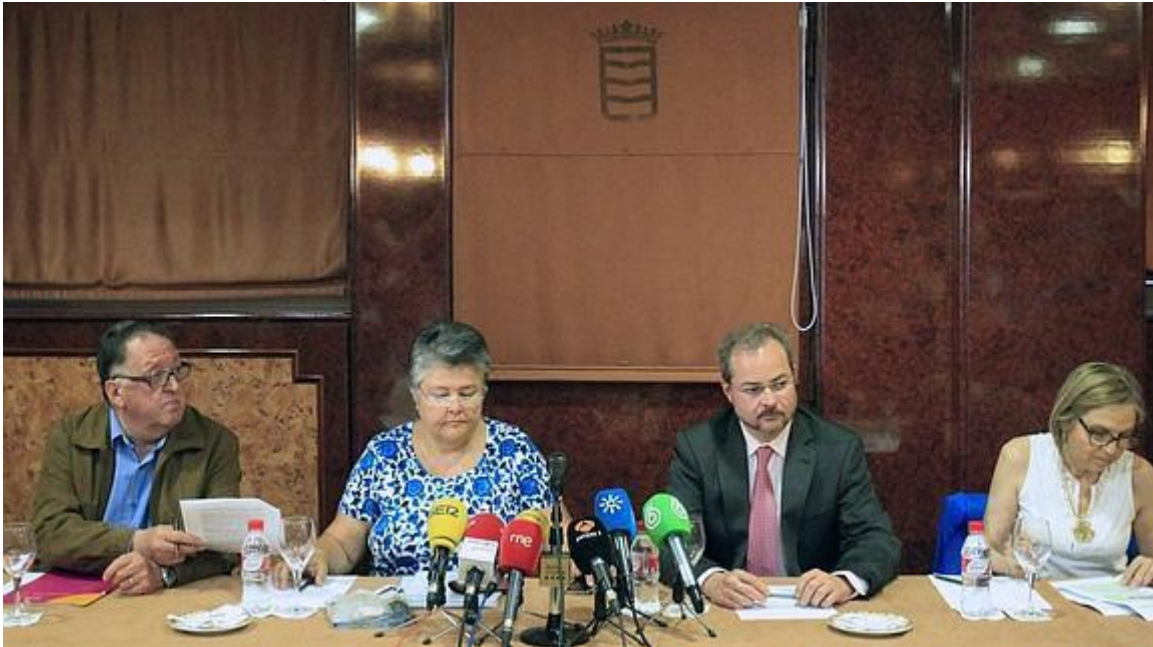
Miembros de la Red de Víctimas de Catástrofes Españolas.

17.05.14 - 16:49 - EUROPA PRESS | MADRID